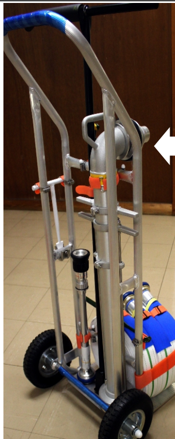
※場外に3基 配備しています。